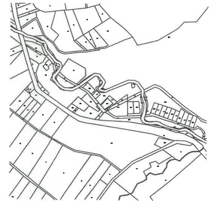
Szkiec orientacyjny 1:10 000