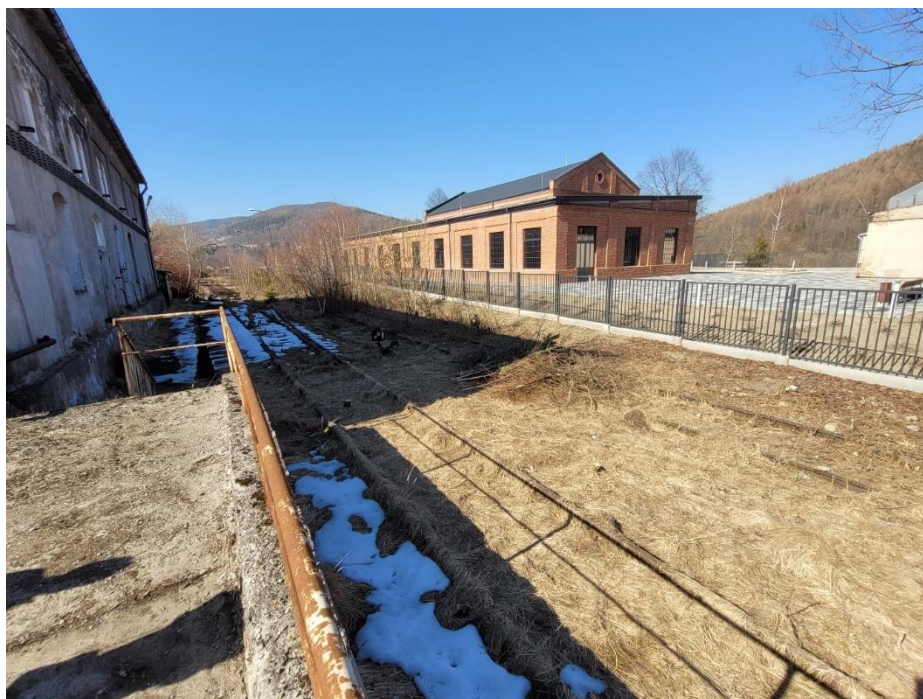
Zdj. nr 8. Tory kolejowe w zespole Rafinerii Nafty „Fanto”

8. Tory kolejowe – położone wzdłuż granicy działki od strony północno-wschodniej. Stalowe szyny ułożone są na podkładach drewnianych.