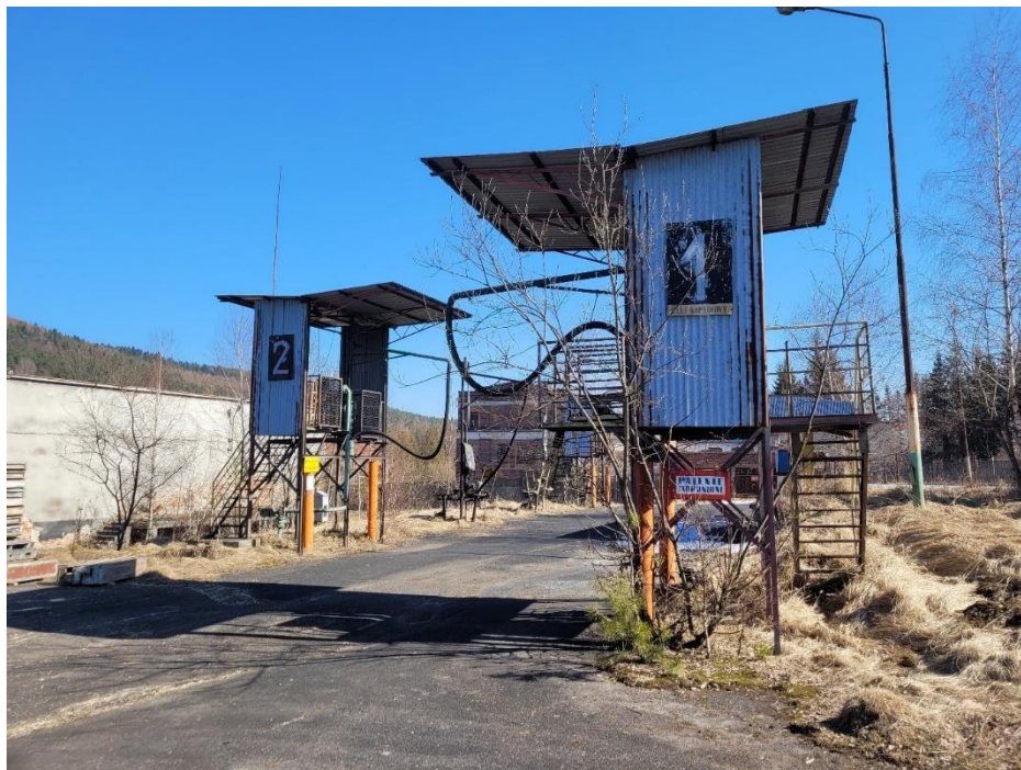
Zdj. nr 7. Nalewaki w zespole Rafinerii Nafty „Fanto”

7. Nalewaki (7 szt.) – powstałe w latach 70.XX w. o konstrukcji stalowej, z kształtowników walcowanych zlokalizowanych naprzeciwko budynku rozlewni oleju i opodal budynku stołówki z remizą.