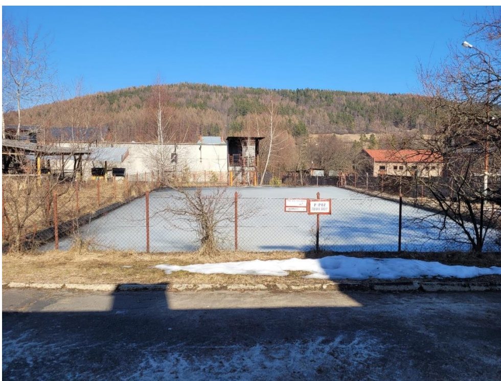
Zdj. nr 6. Basen przeciwpożarowy w zespole Rafinerii Nafty „Fanto”

6. Basen przeciwpożarowy – zlokalizowany przed budynkiem stołówki z remizą, którego ściany prawdopodobnie zbudowane są z betonu. Otoczony jest on siatką.