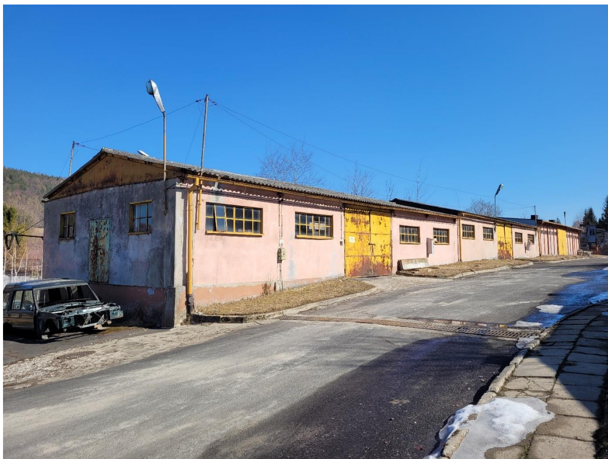
Zdj. nr 2. Budynek magazynu „Pilak” w zespole Rafinerii Nafty „Fanto”

2. Budynek magazynu „Pilak” – usytuowany za budynkiem warsztatu mechanicznego z kuźnią. Powstały prawdopodobnie ok. 1935 r. w okresie przejęcia rafinerii przez spółkę „Pilak”, część północna dobudowana została w latach 50.XX w. Budynek wzniesiony jest na planie prostokąta w konstrukcji szkieletowej. Elementy wypełniające ściany oraz słupy są żelbetowe. Elewacja są gładko tynkowane, które w części południowej budynku rozczłonkowane są rzędami słupów konstrukcyjnych. Wnętrze budynku jest halowe, dwuprzestrzenne, w części południowej budynku z rzędem filarów pośrodku.