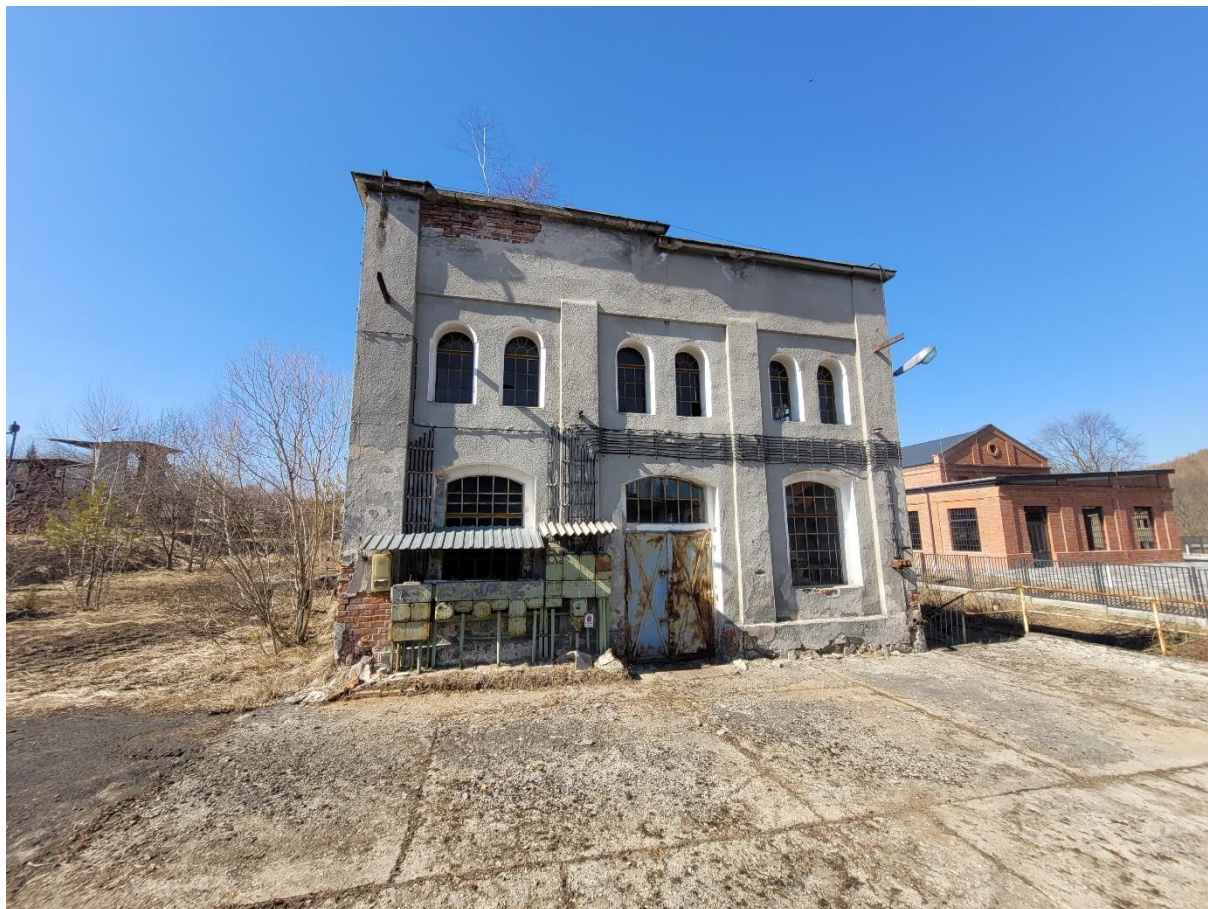
Zdj. nr 3. Budynek rozlewni oleju w zespole Rafinerii Nafty „Fanto”

wnętrzu znajduje się oryginalne wyposażenie tj.: zbiorniki na olej oraz pompy ssąco-tłoczące, z silnikami elektrycznymi żeberkowanymi.