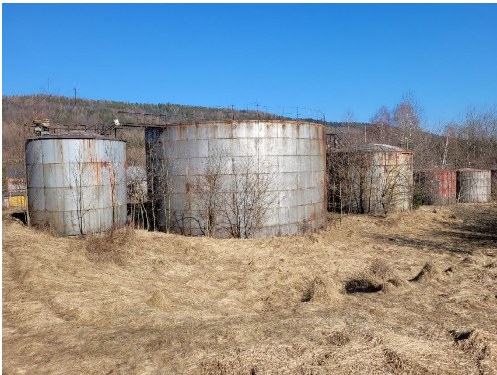
Zdj. nr 5. Zespół 13 tanków w zespole Rafinerii Nafty „Fanto”

6. Basen przeciwpożarowy – zlokalizowany przed budynkiem stołówki z remizą, którego ściany prawdopodobnie zbudowane są z betonu. Otoczony jest on siatką.