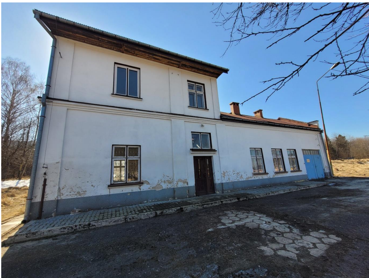
Zdj. nr 4. Budynek stołówki z remizą w zespole Rafinerii Nafty „Fanto”

5. Zespół 13 tanków – powstały w latach 20.XX w. usytuowany jest w południowo-zachodniej części działki. Zgrupowane wzdłuż granicy zbiorniki osadzone są na ceglanych fundamentach. Wzniesione są na rzutach kolistych różnej wielkości, wykonane ze stalowych komponentów, prostokątnych arkuszy blaszanych, układanych pasowo i łączonych nitami. Posiadają różną wielkość oraz pojemność.