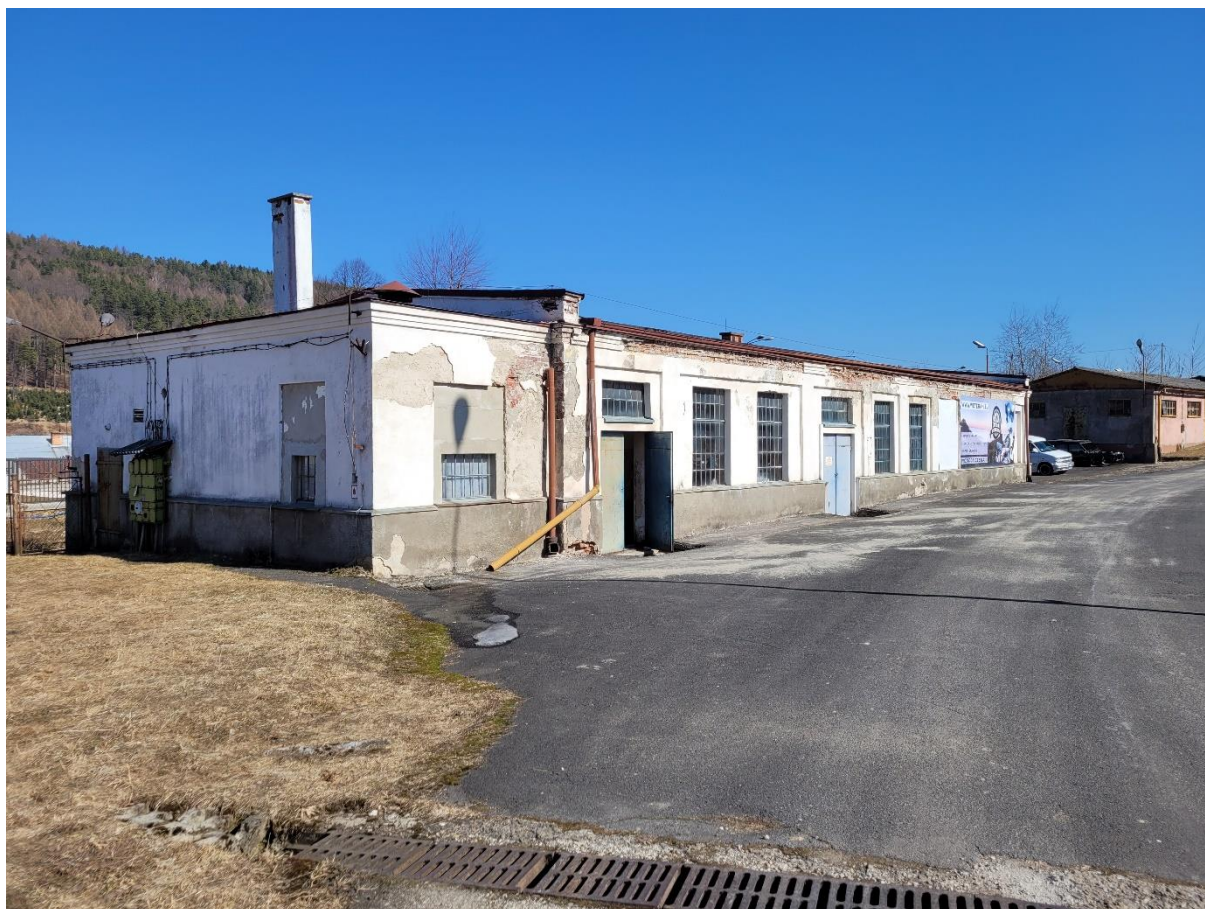
Zdj. nr 1. Budynek warsztatu mechanicznego wraz z kuźnią w zespole Rafinerii Nafty „Fanto”

1. Budynek warsztatu mechanicznego z kuźnią – powstał w latach 20.XX w., zlokalizowany jest w północnej części działki. Jest to ceglany, niepodpiwniczony, parterowy budynek usytuowany na płasko ukształtowanej części działki. Budynek 5-traktowy oraz 11-osiowy w elewacji przedniej oraz tylnej, elewacja boczna jest 3-osiowa a ściany są gładko tynkowane. Elewacje zwieńczone są na całym obwodzie profilowanym gzymsem koronującym. Otwory okienne i drzwiowe ujęte są od góry i po bokach opaskami w formie prostych obramień, cofniętych włącznie względem lica elewacji.